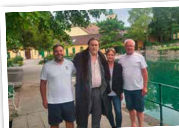
Nicholas Ofczarek bei Dreharbeiten im Thermalbad