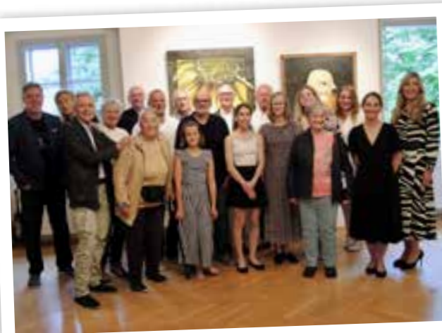
17 Künstler zeigten ihre Werke, entstanden im Lockdown

DO 28. Juli Hauptplatz DO 18. August ehem. Kfz-Werkstatt Willfurth DO 25. August Hauptplatz