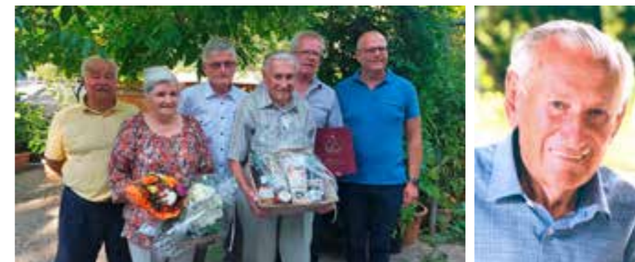
Die Goldene Hochzeit im Jahre 2018 hat die Familie Tiefenbrunner noch unbeschwert gefeiert.

So wollen wir unsren Ehrenbürger in Erinnerung behalten!