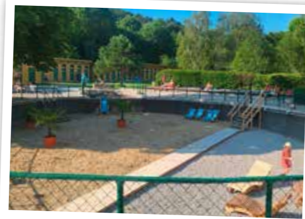
Das trockene Damenbecken weckt das Interesse der Medien