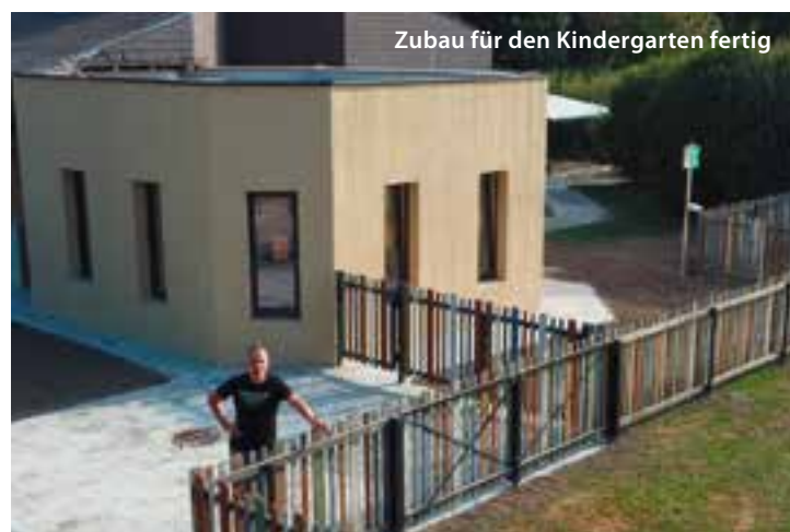
Zubau für den Kindergarten fertig