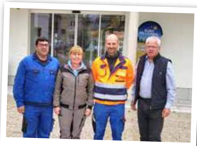
Neue Mitarbeiter am Bauhof