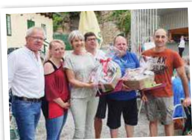
Abschied verdienter Mitarbeiter