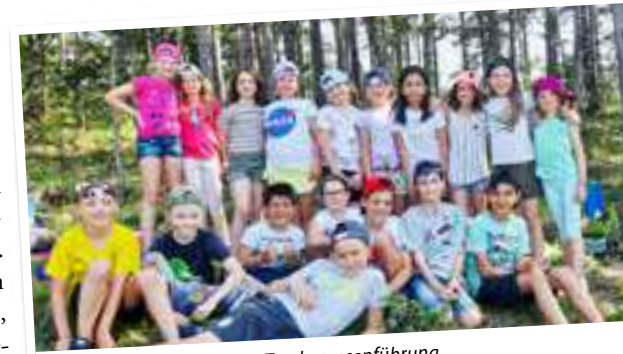
Die Schüler der 3b bei der Trockenrasenführung.

Die Trockenrasenführungen werden von Landschaftspflegeverein und der Natur-