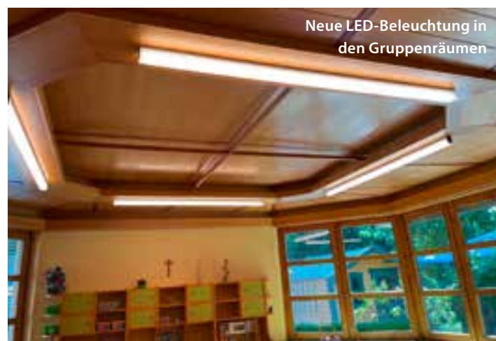
Neue LED-Beleuchtung in den Gruppenräumen