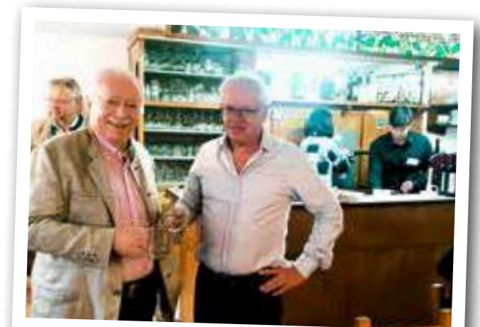
Zwei Bürgermeisterkollegen beim Spritzwein