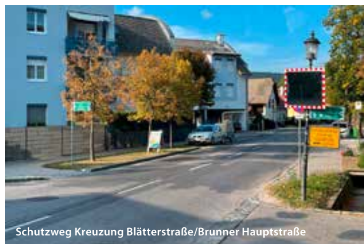
Schutzweg Kreuzung Blätterstraße/Brunner Hauptstraße