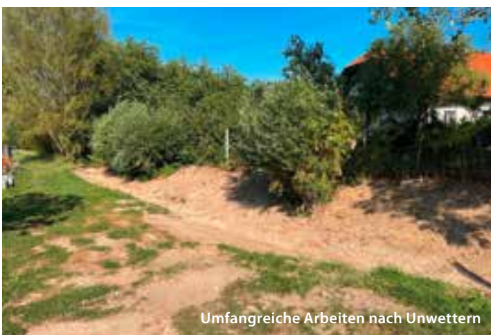
Umfangreiche Arbeiten nach Unwettern