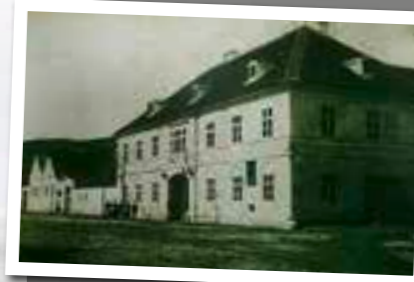
Ehem. GH Habeler