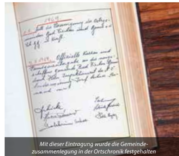
Mit dieser Eintragung wurde die Gemeindegemeinschaft in der Ortschronik festgehalten