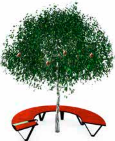
Mehrsortenbaum und Rundbank

Infos unter www.region-schneebergland.at/obst.html oder office@hozang.at / Termine auf Facebook OBST IM SCHNEEBERGLAND.