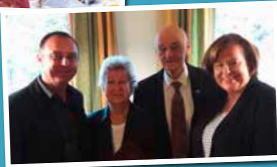
Fam. Ofner zur Diamantenen Hochzeit