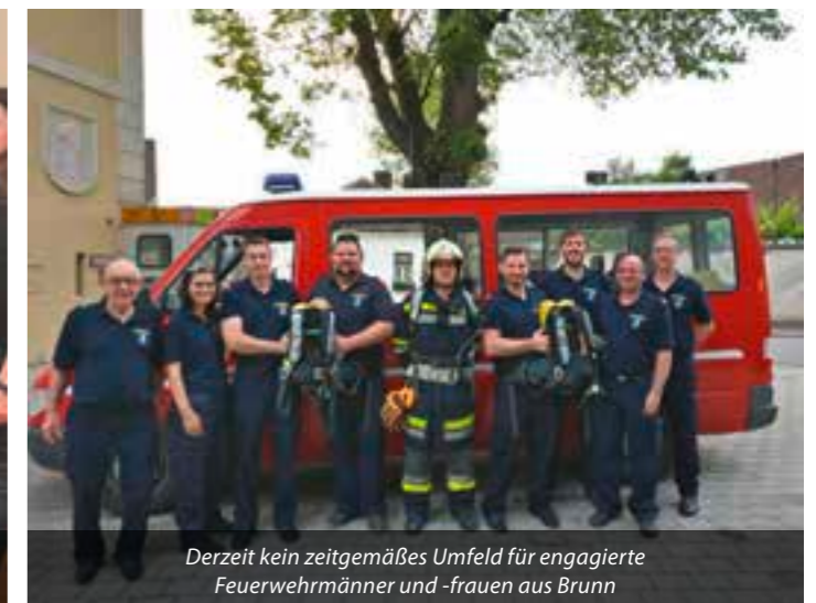
Derzeit kein zeitgemäßes Umfeld für engagierte Feuerwehrmänner und -frauen aus Brunn