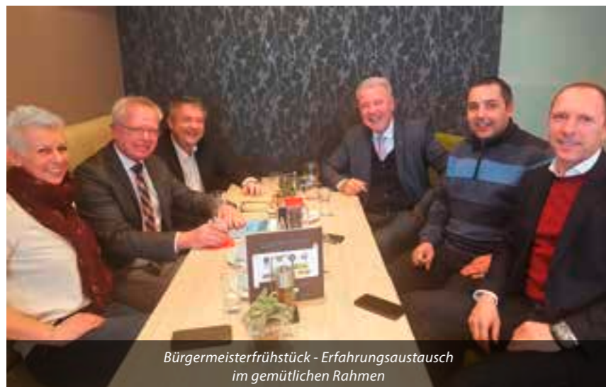
Bürgermeisterfrühstück - Erfahrungsaustausch im gemütlichen Rahmen