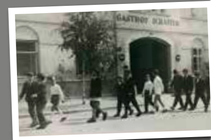
Fronleichnam ca. 1960